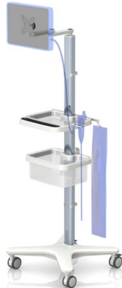
一次性内窥镜检查