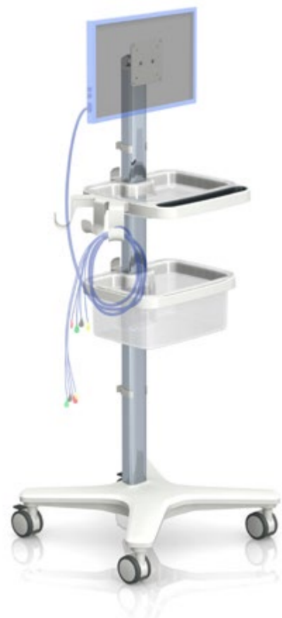
ECG / 超声“一体式”